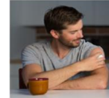
自己採血 (在宅採血)